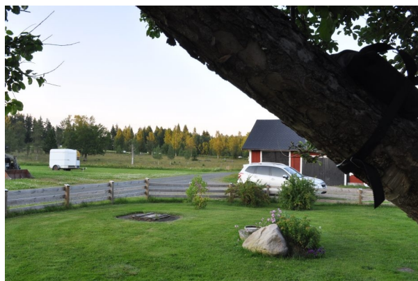
Figur 10. Hjälmsås. Vy från boxplats 7.