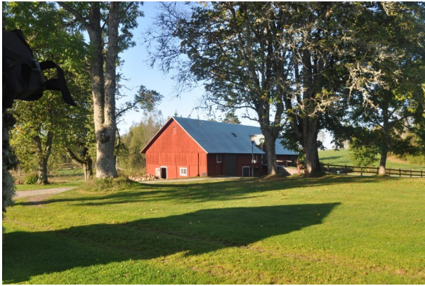
Figur 13. Gårebo. Vy från boxplats 13.