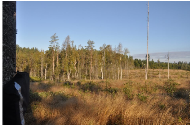
Figur 2. Vy från boxlokal 19.