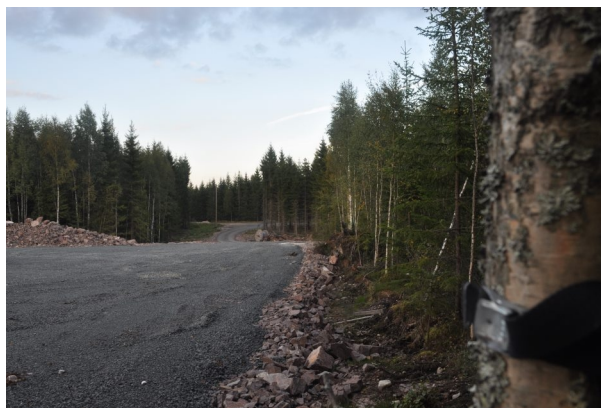
Figur 7. Vy från boxplats 3 vid verksplats 4.