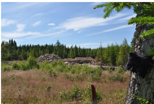
Figur 6. Vy från boxlokal 5 vid verksplats 2.