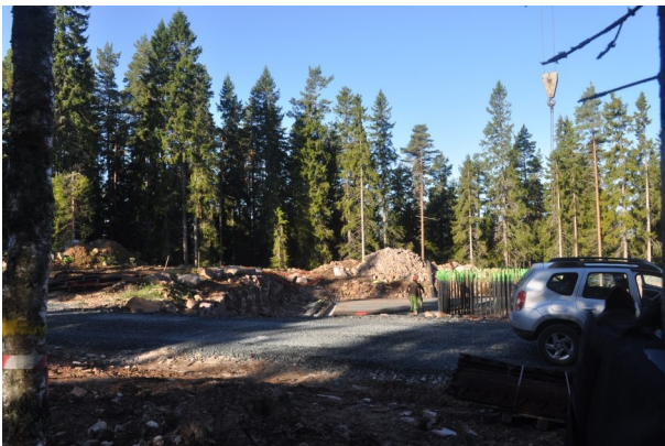
Figur 1. Vy från boxlokal 4 vid verksplats 8.

Rio Kulturkooperativ genomförde 2012 en inventering av fladdermusfaunan inför den planerade vindparken i området (Andersson och Pettersson 2012). Vid inventeringen noterades åtta fladdermusarter, varav två är rödlistade; barbastellfladdermus (EN-starkt hotad) och fransfladdermus (VU-sårbar) (Gärdefors 2011). Med anledning av fynden av barbastellfladdermus har Tranås kommun (diarenr 0768/2013) förelagt Luveryd Vindkraft AB att redovisa en fördjupad inventering avseende denna art. Vidare har länsstyrelsen i Jönköpings län påtalat att en fördjupad inventering av fladdermusfaunan bör genomföras (diarenr 505-6564-2013) med anledning av att de ovan två nämnda arterna påträffades vid inventeringen 2012.