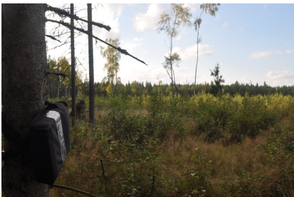
Figur 3. Vy från boxlokal 20 i närheten av planerad verksplats 1.