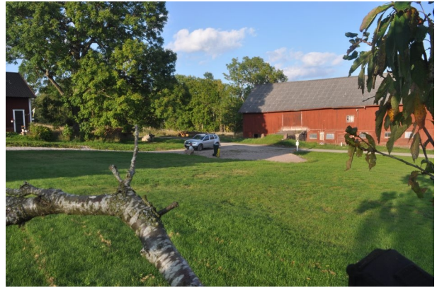
Figur 14. Majmålen. Vy från boxplats 14.

1 Vid kontrollprogram i fyra olika vindparker har en mikrofon fästs i nacellhöjd i totalt fem verk. Mikrofonen har riktats cirka 20 grader neråt i nosens riktning. Inspelningarna pågick i cirka två månader under högriskperioden (mitten av juli-mitten av september). I tre av parkerna har barbastell noterats vid inventeringar i marknivå och i två av dessa har arten noterats mer regelbundet. Vid fyra av verken har barbastell noterats vid boxarna i marknivå men inga noteringar i nacellhöjd har gjorts. Antalet fladdermusnoteringar från hög höjd varierar mellan de olika verken och parkerna. Analyserna av ljudfiler, vinddata och temperaturer är inte klara men de arter som säkert registrerats är nordisk fladdermus, dvärgfladdermus, trollfladdermus, stor fladdermus och gråskimlig fladdermus. Det kan inte uteslutas att barbastellfladdermus stundom flyger i rotorhöjd och därigenom riskerar att dödas men inget i resultatet ovan tyder på att arten frekvent födosöker på hög höjd. Det stöds också av eftersöksdata från Europa där endast någon enstaka individ hittats död vid vindkraftverk (Rydell m fl 2011).