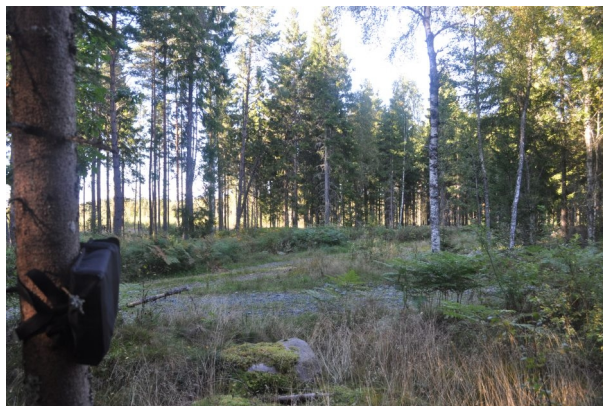
Figur 12. Vy från boxplats 17.