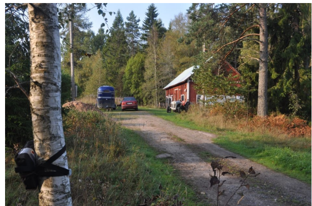
Figur 4. Frinneborg. Vy från boxlokal 21.