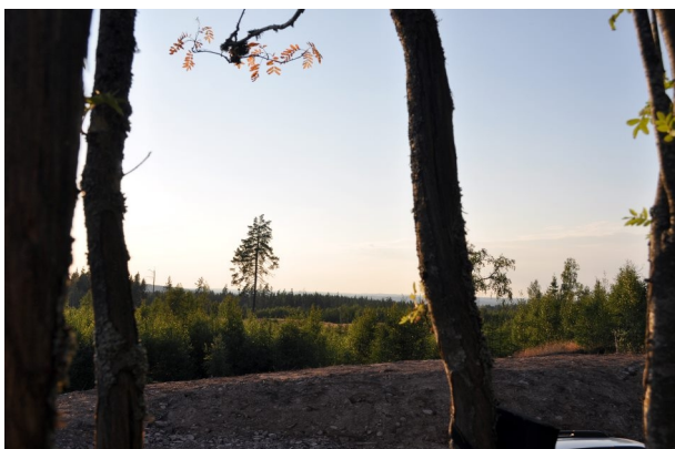
Figur 9. Vy från boxplats 6.

Långörad fladdermus är en vanlig art trots att den förmodligen är underrepresenterad vid inventeringar då ultraljudet den skickar ut är svagt och svårt att detektera på avstånd större än 5-10 meter. Arten förekommer allmänt upp till mellersta Norrland (Ahlen 2011). Arten jagar främst i relativt tät skog (stigar, smågläntor) men även parker och trädgårdar. Arten anses inte vara en högriskart i förhållande till vindkraft (Rydell m fl 2011). Påverkan på arten vid vindkraftsetableringen i området bedöms som försumbar.