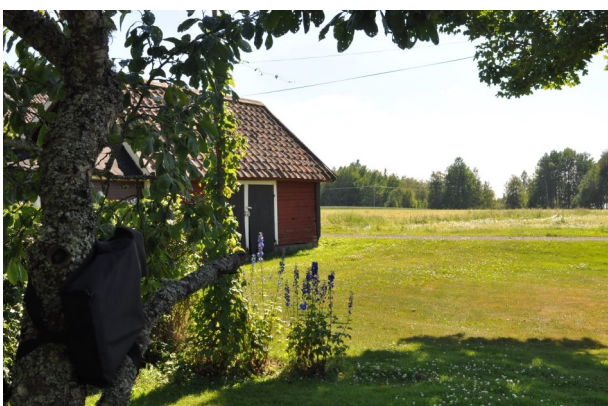
Figur 11. Norra Sunhult. Vy från boxplats 11 (box 35).